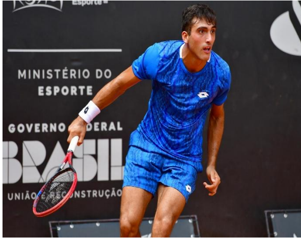
Roman Burruchaga (ARG)